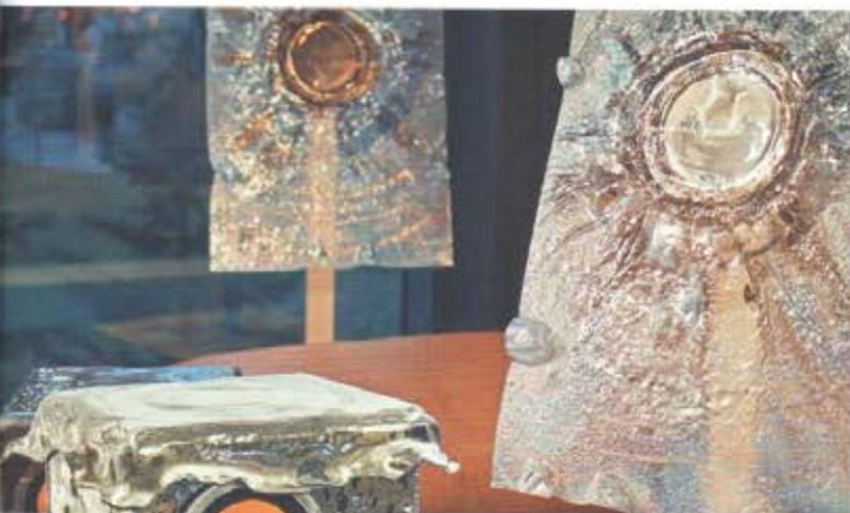
FENIX AUDIO, sada reproduktorov je už vytvorená. Ideou projektu je vytvoriť varianty v podobe hracích obrazov do konkrétneho priestoru s možnosťou zabudovania audiosystému.

príde na rad práve tá moja intuícia, alebo skôr úloha zistiť, čo to je. Prvá vec, ktorú spravím je, že sa pôjdem rozhliadnuť do samotného interiéru, aby som videl, čo ten priestor obsahuje a ako s ním pracovať. Potrebujem ale od klienta informácie ako napríklad jeho obľúbené farby a tvary. Na základe toho vycitím charakter toho človeka a napasujem mu výtvor na mieru. Je to vyslovene umenie šité na mieru.